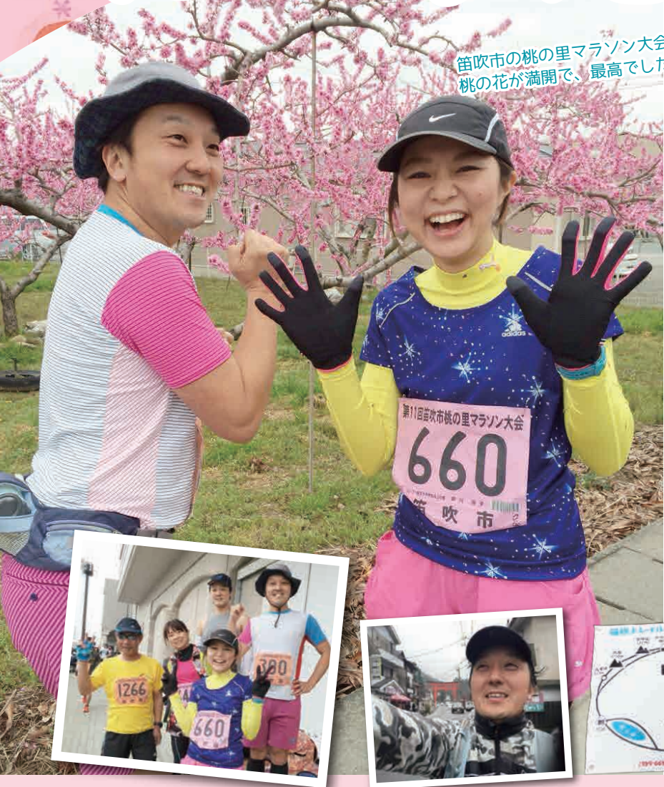
笛吹市の桃の里マラソン大会!! 桃の花が満開で、最高でした~