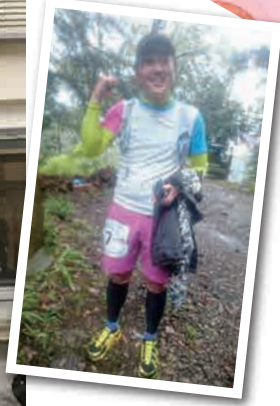
春、馬区いまくってます!! 箱根の50kmトレイルに参加しました。 雨が降っていて、寒かった~