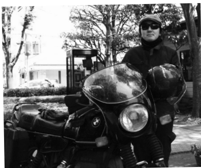
セルフタイマーでパシャッ！

とにかく天気が良かったので、気持ちよく手を合わせて帰ってきました。沼津港で「漁師丼」も食べてきましたよ。駿河湾で採れた海の幸は、やっぱりウマかった！アツイ夏に向けての充電完了です！