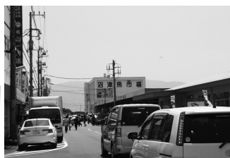
車で行ったら駐車場が一時待ち！(どひゃー)バイクで良かった…。

直径30センチくらいの大きい丼。しかもみそ汁をおかわり自由で980円ナリ。安いです！