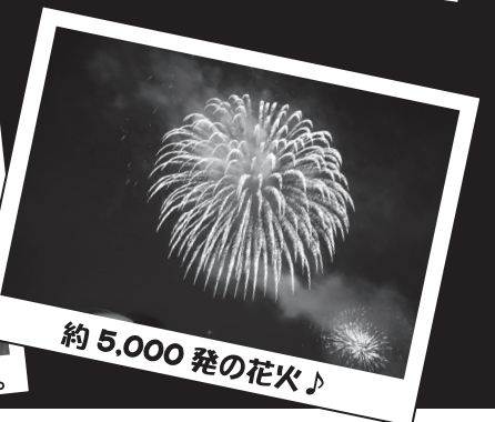
約 5,000 発の花火♪