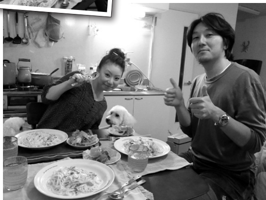
心温まるパーティーに感謝!!

います。 この歳で頂くお客様の指摘とい うのは、ホントありがたいです。 若い自分にとっては「お小言」でも、 今の自分にはそこに「金言」もある と感じています。事業の代表者とも なりますと、自分を戒める場面が極 端に減ります。私みたいな人間は、 根っこがお調子者ですから、常に目 上の方に指摘されながら上を目指 していく方が、いいんじゃないかと 思うんです。という訳で、34歳のこ んな男ですが、これからもお客様の 笑顔と幸せをチカラにしなが、一 つ一つ成長していきたいと思いま す。