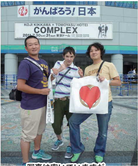
写真は空いていますが、2時間後、会場前は大混雑でした。