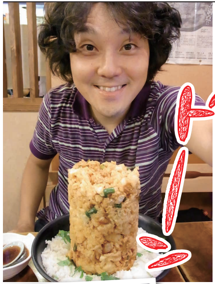
←普段はお店の前に行列ができていますよ。

そんなカラーになったばかりの紙面で、何とも色気のない、お墓参りの話題からスタートです。バイクを手放してしまっただ今、渋滞を避けるには早起きしかない！ということで朝早