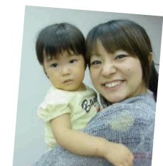
去年、私にだっこされて大泣きした従姉妹の子ども、今年は慣れてくれました♡