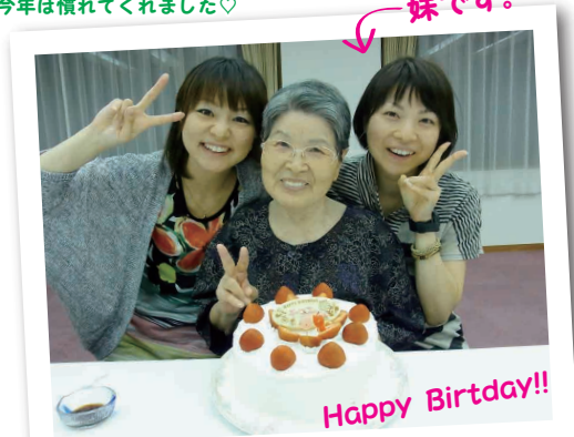
おばあちゃんとの写真撮影は、ディズニーランドのミッキーくらい(笑)大混雑です。