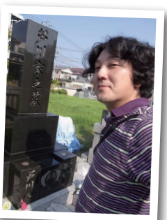
↑掃除が終わって満足、満足♪

そんなこんなで、繁忙期の9月を前に、ご先祖様へ「お仕事順調です。ありがとうございます!」の報告が出来て良かったです。今度はお正月かなあ。